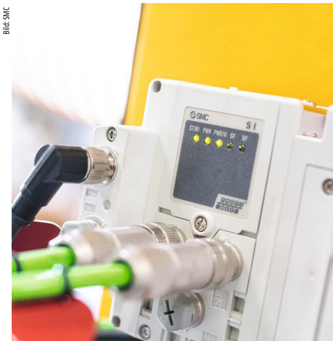
Busmodule der Serie EX600 von SMC ermöglichen die einfache Integration der modularen Ventilinseln in die übergeordnete Steuerung.

Die Digitalisierung ist auch in der Automobilindustrie angekommen. Die Portalfräsmaschine muss